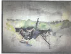
"La Roche Basse", aquarelle par Annie Franklin